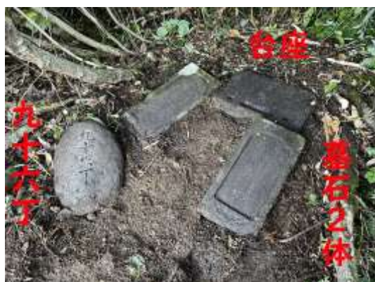
T 5 ; 元高清水 ( “高清水小屋” 跡)