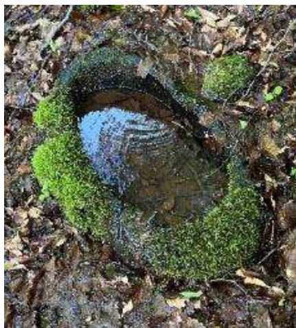
T 3 ; 石船