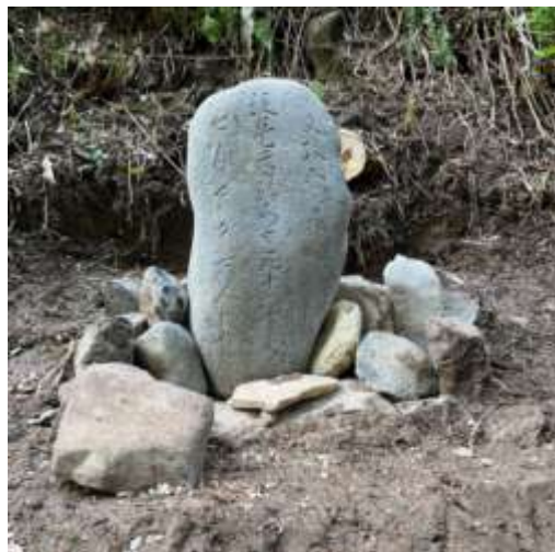
T 1 ; (丁石) 起点記念碑