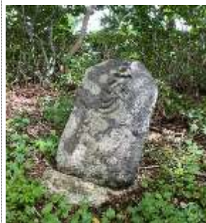
K 2；不動明王（カンマン）碑