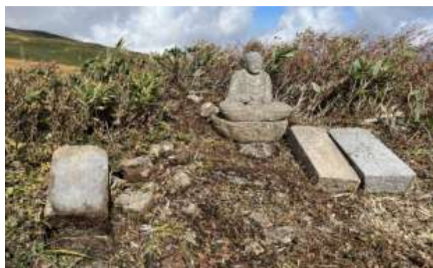
K 5；来名戸神（くなどかみ）