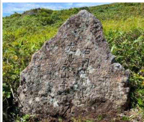
K 6；『月山 湯殿山』追分碑