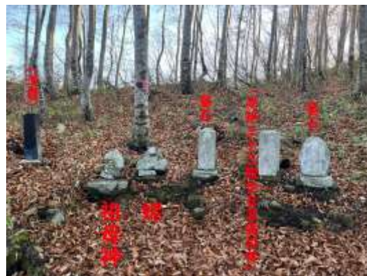
T 2 ; 姥像等石碑群