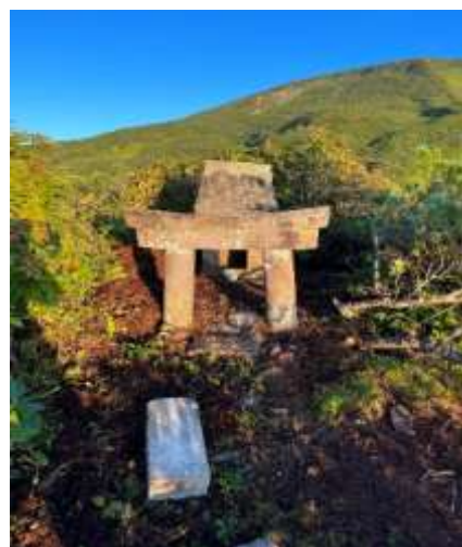
K 4；清川 御所王子社（五所皇子稲荷神社）