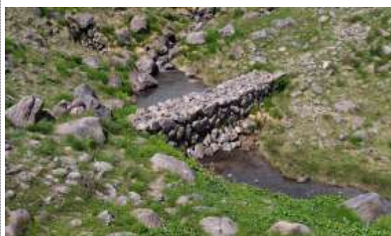
T 6 ; 天空石橋(てんくうしゃっきょう)